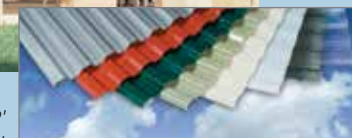
Plateado Solar Control Rojo ladrillo Verde Cazador Verde difuso Crema Blanco opalino Gris Solar Transparente