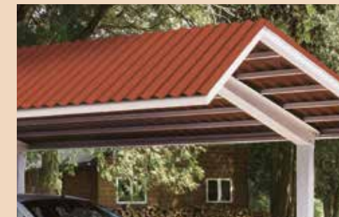
Tamaños estándar: 26" de ancho - 8', 12'