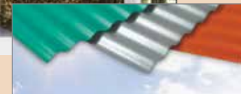
Verde bosque tropical Gris castillo Rojo ladrillo