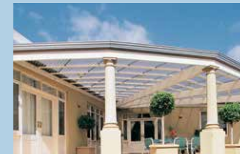
Tamaños estándar: 26" de ancho - 6', 8', 10' y 12' 49.6" de ancho - 8', 12' y 16'