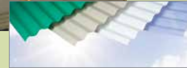
Verde, Beige, Blanco, Transparente