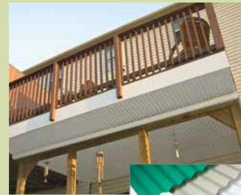
Tamaños estándar: 26" de ancho - 8', 10', 12' Beige: 26" x 8' solamente